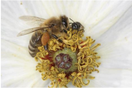
Honigbiene und Wildbiene auf Spiegeleipflanze

Wo legen die Wildbienen ihre Nester an? Schaut euch die Namen dieser verschiedenen Wildbienen an und stellt darüber Vermutungen an, wo sie ihre Eier ablegen! Vergleicht anschließend die Nistplätze der Wildbienen mit dem Nistplatz der Honigbienen.