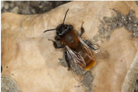
Die Sandbiene