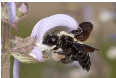
Die Holzbiene