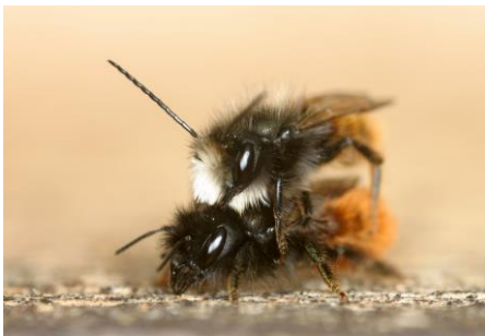
Gehörnte Mauerbienen