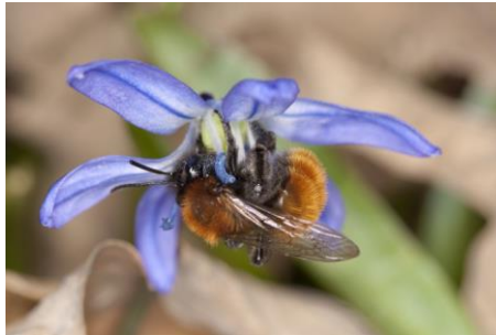
Die Sandbiene