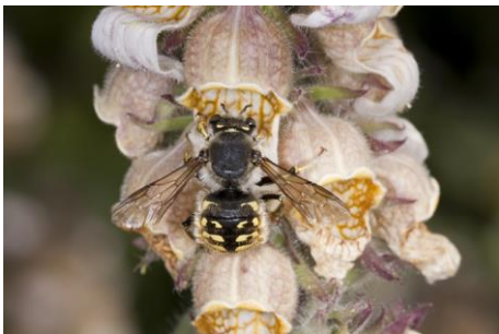
Die Wollbiene